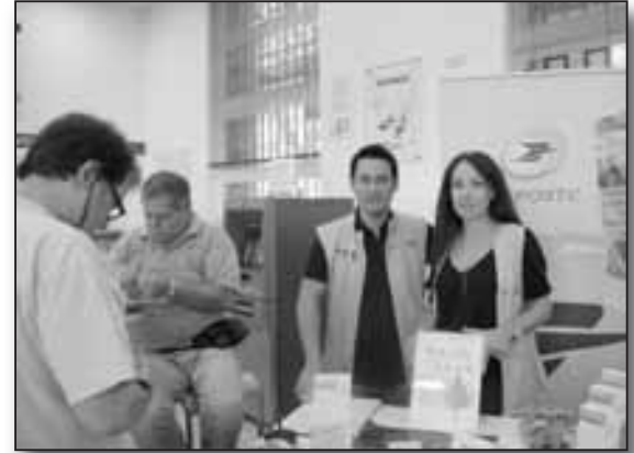
Présentation de la "Lettre verte", le 30 septembre 2011 à La Poste Bastia-Saint Nicolas